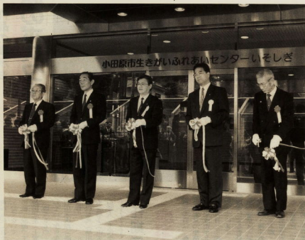
九月二十八日に行われた竣工式のテープカット

用できます。小田原市シルバー人材センターも、同施設内に移して業務を拡大し、就業の場の確保に努めます。【今日】15時から「いそぎ」では、高齢者文化祭「いそぎフェスタ」で、小田原の各種行事が開催されます。