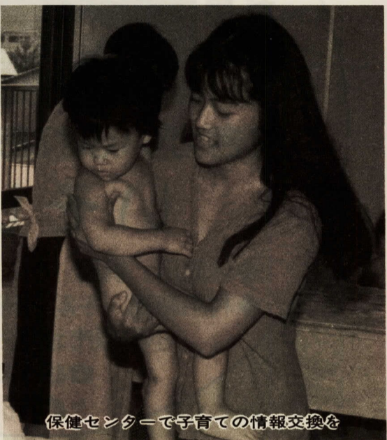
保健センターで子育ての情報交換を

ようか。 酒匂にある保健センターは、マタニティクラスや乳幼児健診などで私たち母親にはおなじみの場所。こちらには、たくさんのお母さんに関する相談が寄せられるそうです。保健婦さんのお話によれば、今の母親たちは、とにかくはじめで一生懸命。何冊もの育児書を読みあさり、知識は完璧。しかし、少しでも育児書のとおりにならないと、たちまち不安になってしまふ。また、女性の高学歴化が進み、ハイレベルな育児をする母親が目立つとのこと。砂遊びよりパズル。しっかりとした教育観を持ち、「将来のために」と幼いころからスイミング、英会話と習い事もしつかり。どの母親も子