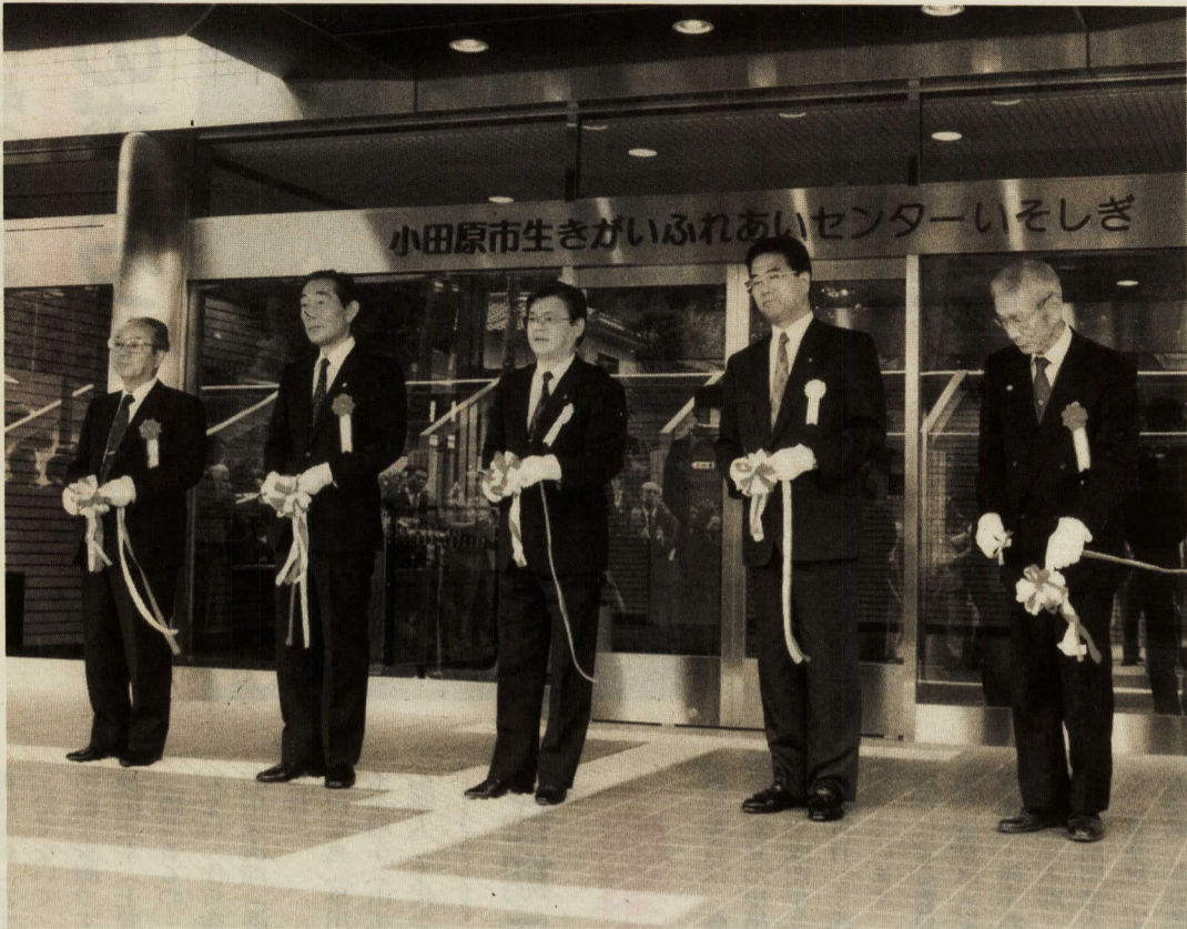
九月二十八日に行われた竣工式のテープカット

用できます。小田原市シルバー人材センターも、同施設内に移転して業務を拡大し、就業の場の確保につとめていきます。今日十五日から、いそしぎでは高齢者文化祭「いきいきフェスタイン小田原」の各種行事が開催されています。