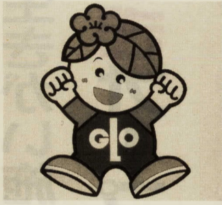
マスコットマーク

平成5年10月に上府中公園で開催される「かながわ都市緑化小田原フェア」のシンボルマーク・マスコットの入選者が決定しました。