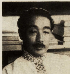
郷土文化館に所蔵されている北原白秋関係資料を、常設展示されているものに加えて展示します。