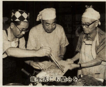
食生活にも関心を

職場などで健康診断のない方は、年に一度、基本健康診査を受けましょう。 ■基本健康診査 肺がんと大腸がんの検診をご希望の方は受診時に申し込んでください。