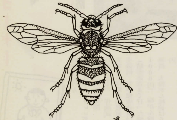
キイロスズメバチ

人を刺すハチの中では最も毒性が強く、最も身近にいる種類です。軒先や戸袋につくられた張りぼて風の丸い巣は、秋が深まるにつれ、直径四十センチにもふくらみ、数百匹の大所帯になります。特にオオスズメバチがキイロの巣を襲う頃になると、キイロは異常に興奮しますから、要注意です。