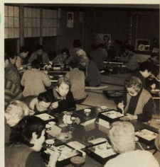
おいしい食事と話がはずむ