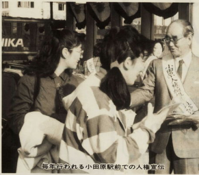
毎年行われる小田原駅前での人権宣伝

昭和三十三年十二月十日、国連総会世界人権宣言が採択され、この日を「人権日」としました。わが国では、毎年十二月十四日から二十一日まで「人権週間」と定め、全国各地でいろいろな活動が展開されています。 本市においても、この期間中、人権相談や人権宣伝を実施し、人権意識の普及を図っています。人権とは、幸福な生活を営むために必要で、人間として固有の権利といわれています。