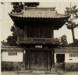
正恩寺の鐘樓門(正門)

今回の講座は、明治前半期の史料を教材にしながら、江戸から明治へと変遷する時代の中で、小田原の人びとの生活の様子に生かす、町をつくりあげていくの姿を分りやすくお話しするつもりです。講師は、専攻書目録の全4回にわたって、友誼士お話し会