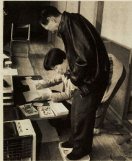
体重の増減は健康のパロメータ

小田原市では民生委員・児童委員を約240世帯 に一人の割合で委嘱しています。任期は3年で、 3年ごとに約3分の1の方が新しくなり、 3分の2の方が引き続きお願ひしています。 委員さんは3人1組の地域ボランティアの方をバ ートナーとして、それぞれの地域で多くの福祉 活動に参加し、活躍しています。今回は、その 活動について紹介します