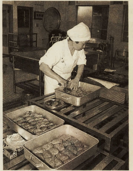
おいしい給食を子どもたちに

市では、次のとおり学校給食調理員を募集します。ご希望の方は、お申し込みください。 詳しくは、「小田原市職員(学校給食調理員)採用試験の案内」