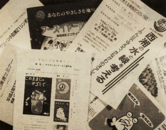
あなたも参加を、ゴミを見る目が変わります。

今年もあとわずか。いつもの何倍ものゴミの量に収集車は大忙し。教えれば小さい子どもでもできるゴミの分別。ここで、もう一度、わが家のゴミをチェックしてみませんか。