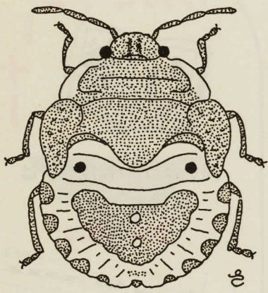
アカスジキンカメムシの幼虫

心の忙しさとは反対に、のんびりと、ぼかんと抜けているような日溜が、足の向く先に、待っているのである。歳をとったからではなく、若い頃から冬の日溜は、好きだった。こゆるぎのクヌギ林を歩きまわると、何となく虫や小動物の気配を感じるような、ぼかぼかの日溜がみつかると、その一つに「水ノ尾威張山」があった。