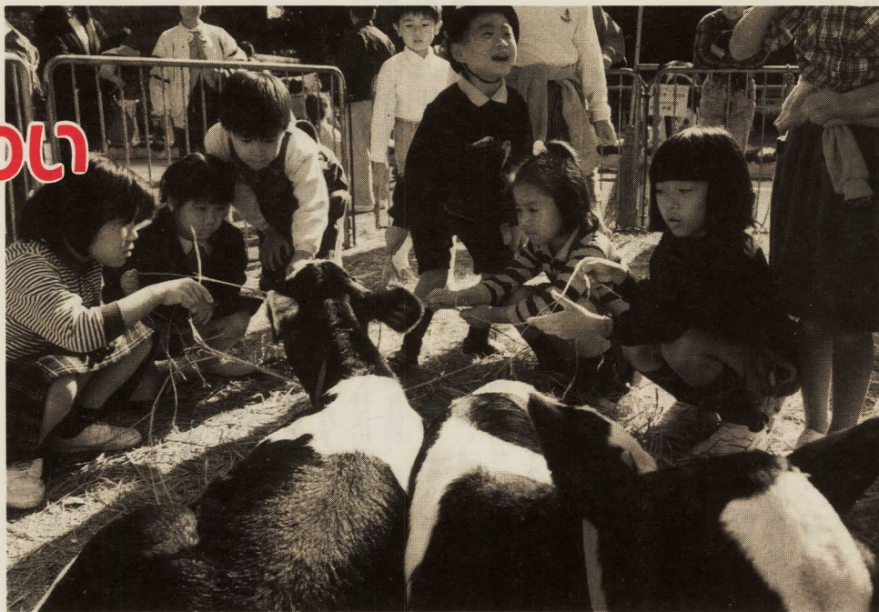
ミニ牧場で子牛と遊ぶ子どもたち

去る十一月二十二日、二十三日の両日、旧城内スポーツレクリエーション広場で、農業まつりが開催されました。この農業まつり、本市農林産物を一堂に集め、農業を広く市民に紹介することによって、農家と地域の人の相互理解を深めてきました。会場では、農林産物の展示・即売会、ふるさとの味コーナー、ミニ牧場、おはやし会、おどりの会による舞台など、多彩な催しが繰り広げられました。天候にも恵まれ、家族連れなど三万三千人の方で賑わいました。