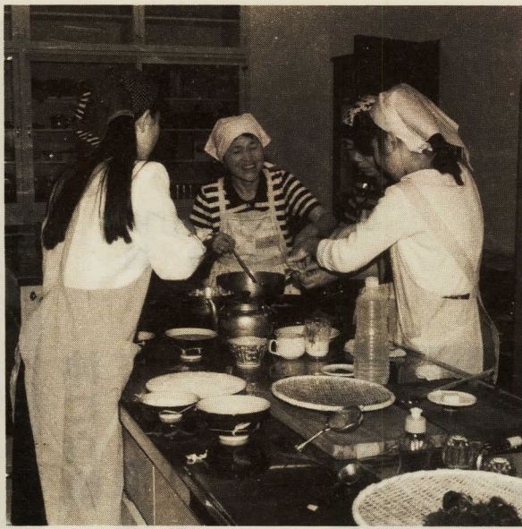
いつも楽しいお料理

教育委員会では、中央公民館 三期・中央公民館分館後期成人学校を来年一月から開講します。どの講座も初心者を対象にしたものですので、お気軽にお申し込みください。 申込みの受付は、一月中旬の予定です。 なお、科目については変更になる場合もあります。