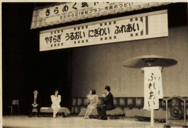
まちづくりトリークでは貴重な意見が

市では、月二日、中央公民館大ホールで、おだわら歴史館・プラン・市民のつどい、きらめく城下町の序章」を開催しました。 この催しは、おだわら21世紀プランの後期基本計画をみなさんに知っていただく、共にまちづくりをしていくための契機とするもので、約三百人の方のご参加をいただきました。 北條大鼓の演奏で始まり、第一節「きらめく未来を子どもたちの手で」、小・中学生の「わたのすなま小田原」