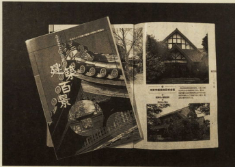
■発行された「ふるさと小田原の建築百景」