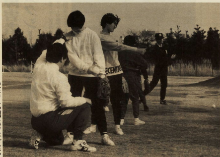
熱心にコーチの指導を受ける子どもたち

今日六日の土曜日、酒匂にある県立西湘地区体育センターで、子ども国体・夢教室が開催され、市内の小学校三・六年生約百人が集まりました。この催しは、平成十年に神奈川県で開催される国体で、小田原市がバスケットボール、ソフトテニス、ソフトホールの三種目の競技会場になることか