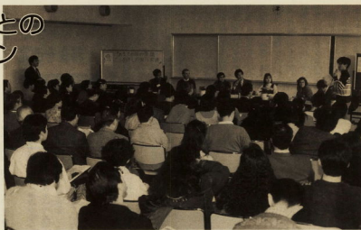
参加者から質問や情報提供が

同じ六日の土曜日、中央公民館では文化振興課が主催して「集まれ地球市民、あなたの国の常識、わたしの国の常識」と名付けた、市内在住の外国人の方々のパネルディスカッションが行われました。