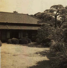
大正・昭和期の美濃家望月軍邸の別荘

お知らせ 国民年金保険料 納めましたか 国民年金の第1号標準保 険料は、平成5年1月まで に加入手続きを済ませた学生の 成る年度は、月額9,700円 を月次納付することにな ります。納付の忘れはあ りませんが、ご確認のうえは 国民年金保険料の納付の 忘れなど、万円の事故が おこらないよう、国民年金 の納付は、お忘れなさい。納 付の忘れは、お忘れなさい。 納付の忘れは、お忘れなさい。 納付の忘れは、お忘れなさい。 市税や保険料は納付済みですか 市税や保険料は、納付済み ですか。納付済みでない 場合は、お忘れなさい。納 付の忘れは、お忘れなさい。 納付の忘れは、お忘れなさい。 納付の忘れは、お忘れなさい。