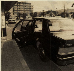
利用できるタクシー会社は単に登記してあります

市では、市内在住の障害をお持ちの方の在宅参加促進として福祉増進を図るため、タクシー料金を補助して利用を奨励しています。