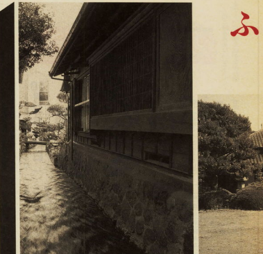
■杉崎邸と小田原用水(板橋) 明治後期の建築 格子のある建物と清らかな水の流れが、見る人の心を和ませる