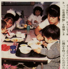
白衣を着てあなたも優しい看護婦さん

●日時 七月十七日(土) ●会場 小田原市立病院 ●内容 病院見学、病棟での看護体験、ビデオ撮り、白衣を着ての看護体験、看護婦さんとの交流、記念撮影など ●申込方法 往復はがきを二枚用意し、住所氏名、年齢、希望日、希望学年を記入し、おだわら市役所市民生活課に提出してください ●申し込み期間 七月九日(日)まで ●申込先 小田原市立病院看護課