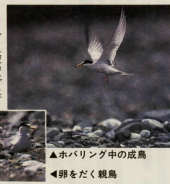
●ホバリング中の成鳥 ●卵をだく親鳥

初夏、広い河原を歩いていると、突然頭上、「キッキキキッ」という鳥の声を聞くことがある。彼らは、人の歩いて行く方向へ一緒に飛でくる。そして時折、頭上に急降下し、運の悪い人は、フンの爆弾を足蹴りしてしまう。何ぞ、こんな事をするのだらうか……。よく注意して見ていると、少し離れた所では彼らのホバリング