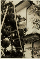
ていねいな植木の剪定作業

今までは国民票・印鑑登録証明書・戸籍簿と、住所地の支所から発行されていた「戸籍長」が、七月一日からは「戸籍長」が、各所へ連絡をマフックとしてつづいており、この間日ごとでつづいており、