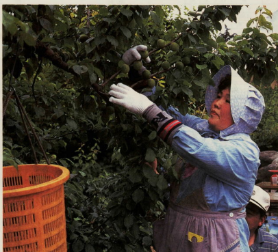
収穫された生梅は東京市場へ初出荷

五月三十日、曾我の生梅の収穫が始まりま した。 五百年前から栽培されていたと言われる曾 我の梅は、果肉が厚く、種が小さいのが特徴 で、毎年六月から七月初旬に収穫、出荷され ます。 今年も、初夏の訪れとともに収穫を迎えた 曾我の梅林では、梅の実をていねいに扱う農 家の方の姿が見られました。 収穫された生梅は、梅干、梅酒、梅ジャム、 梅ジュースなどに姿を変え、家庭の健康・自 然食品として利用されます。