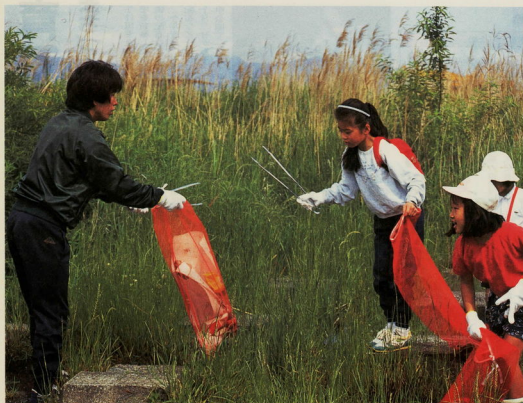
この日拾われたごみは7,520トンにも

酒匂川流域の一斉清掃「クリーンさか わ」が、五月二十三日に行われました。 この日、酒匂川の美しい自然環境を自 分たちの手で守ろうと、集まった参加者 は二千七百四人。小さな子からお年寄り までが、報徳橋から酒匂橋の間を一時 間、 かけ、紙くずや空き缶などを一生懸命に 拾い集めました。 自然へのやさしい姿が見られた白曜日。 参加した方々の顔には、ごみを捨てない ようにみんなが気を付けてほしいとい う気持ちが表示されていました。