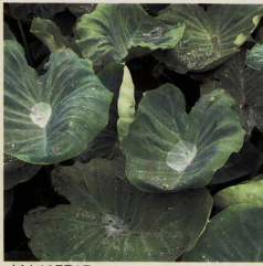
水をためる里芋の葉