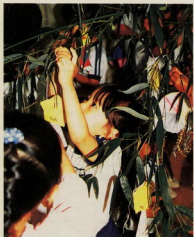
保育園での飾り付け

七月の行事 七夕・天主祭 山主祭 七月の行事として又、天王・山主の祭を紹介しよう。七月七日までは、江戸幕府が定めた五節供の一つである。古来の棚掛つ女水遣の儀を祭場として神と迎へ、織機を祭つて巫女の信仰に、中国から伝へられた雑牛・織女星の年水をためる里芋の葉を