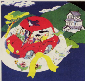
「道の日」フェア'93(小田原会場)のイメージイラスト

住みよい都市環境をつくり出すために、幹線道路から生活道路まで、総合的な道路交通体系の整備が必要とされています。私たちのまち小田原でも、思まれない自然環境や、豊かな歴史的文化遺産という、「小田原らしさ」に都市機能を調和させた人々にやさしい道づくりが求められています。その実現には、市民の皆さんの協力がなくてはなりません。