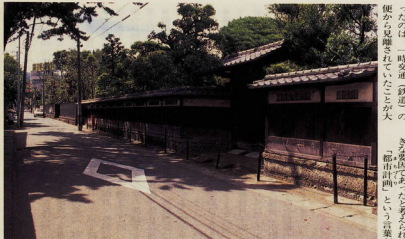
今なお城下町の面影が（市内栄町4丁目）

得ました。その説を聞かせてと絵本作りコース。手話とカードゲームコースの二つのコースから、自分の得意分野または興味のあるものを選択し、幅広い範囲で楽しく学習してきます。 卒業後は、地域の老人会や子ども会などで活動も続けます。