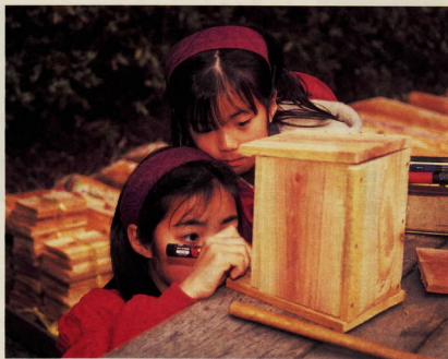
鳥の巣箱づくりに夢中な姉妹