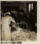
役立つ介護の実験

市立病院では、「看護週間」に合わせて、みなさんに家庭介護の実際を体験していただく催しを行いました。テーマにもなった家庭介護を、あなにもご自身の体験を通じて、ぜひお出掛けください。