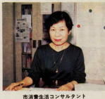
市消費生活コンサルタント

「解約したい」と 思ったら 突然断ることがあります。そのときも慌てずにお電話をください。解約したいという旨を伝えてください。電話で断る場合は、電話で断る旨を伝えてください。電話で断る場合は、電話で断る旨を伝えてください。