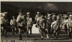
おだから創造のメンバー

●補助内容 事業経費のうち、人件費委託料、食料費等を差し引いた額で、一事業または経費の五十パーセントまたは三十万円を補助いたします。