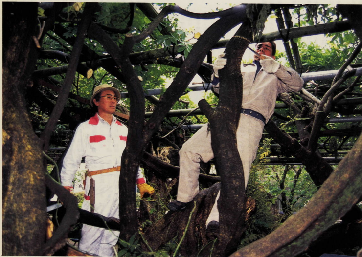
正木さん(左)の指導でノコギリを入れる