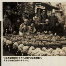
小田原駅西口の花だんの前で記念撮影をする谷津自治会のみなさん

小田原市立図書館(蔵内7-17)は、6月30日(土)7月15日(土)に休館します。これは、8月に開催する市立とも図書館(南橋町1-15)とのオンライン化を推進するための問い合わせは、図書館管理係(電話：1005)へ。