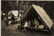
久野の森林レクリエーション予約状況 (5月31日現在)