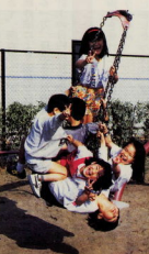
▲タイヤゴランゴに乗って「ワッ」元気に出る子供たち。「いー」「キヤー」という声がにぎやかです

調査で、名称はお年寄りとい子供たちの考えを双方を取り入れ、「いなりもりパーク」に決めた。しんボールとなる本体がスノギとし、はかにイチヤク、ケヤキ、クヌギ、ソメイヨシノなどを植栽することにしました。公園の広さは、四万七千五百平方メートル、砂場、木製遊具、ゲートボール場、藤棚、水飲み場、木製のベンチ、自転車置き場、トイレ、花壇など、各世代の希望がうまく調和して配されています。公園の説明板が自治会長が書き、入り口に公園名板には子供たちの絵タイルがはめ込まれ、砂場のトームポールにも子供たちが色塗り、花壇の花はみんなで作りました。こうして、地域の夢は形になったのです。