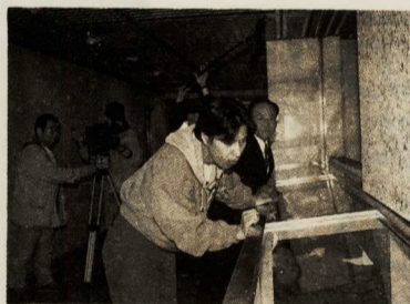
「このまちだいすき」制作風景

「小田原の人は保守的で、城下町ですから」 遠慮がちにこう言う私に、彼らは等しく首をひねる。 「そんなことは無いですよ。減法明るくて、茶目ついたつぷりでね」「お人好しと言ってはどうかと思いますが、ちょっと珍しいですね。こんなに誰もがノリやすいのは、やっぱり豊かだからですよ」 「私たちは仕事柄、全国各地を訪れ、その地に一年間じっくりと腰を据えて番組制作に取り組みんで、その土地の個性は確実に把握しますよ。小田原人は間違いなく開放的で親切です。保守的・閉鎖的なんてことは、絶対ありません」 四月からNHK教育テレビで週二回、小田原を舞台に、「このまちだいすき」という小学三年生向けの連続ドラマが放映されている。冒頭のやりとりは、この制作スタッフと私の会話である。 実は、この番組に即席タレントが大挙出演している。商店の女将さん、サラリーマン、ミス小田原、市の職員、寺の住職、