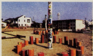
▲ 子供たちが色塗りをしたトーマスポールは、砂場に建てられました