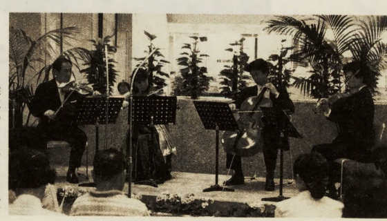
昨年のコンサート風景

市民の皆さんが気軽に音楽を楽しめる「市民ロビーコンサート」を開催します。今回は、本市出身の東京芸術大学在学学生・卒業生が結成する「小田原市人会」の歌声をお届けします。