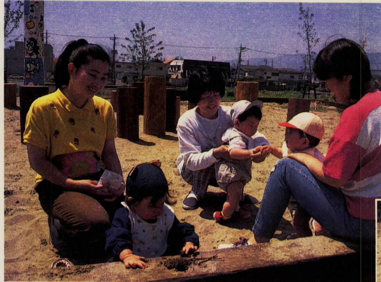
▲ 午前中の子供を連れての砂端会議。近所の若い主婦たちの交流、情報交換の場です 砂場での水遊びやおだんごづくり。子供が好きなことは、いつの時代も変わらない?

7月27(水)の2泊3日 塔ノ峰青少年の家 事前研修 7月16日(土) *詳しい日程は、参加者に通知 ●対象 市内の中学1年生で、全日程に参加できる方 ●定員 40人(先着順) ●受講料 無料(傷害保険料500円だけ自己負担) ●申し込み 個人単位で受け付け。保護者(代理も可)が6月17日(金)から30日(木)までに、電話で申し込みを。 ●その他 事後講座も予定 ●申し込み・問い合わせ 青少年課育成係 ☎33-723