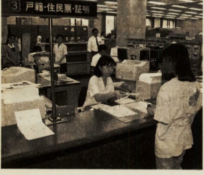
戸籍・住民票・証明

ビスが悪かろうと倒産はありません。その行政が、自らの改革に腰が重い現状を直視し、「これではいかん」と、職員の意識づくりと組織風土の改革に取り組む始めたというのは、評価に値することではないでしょう