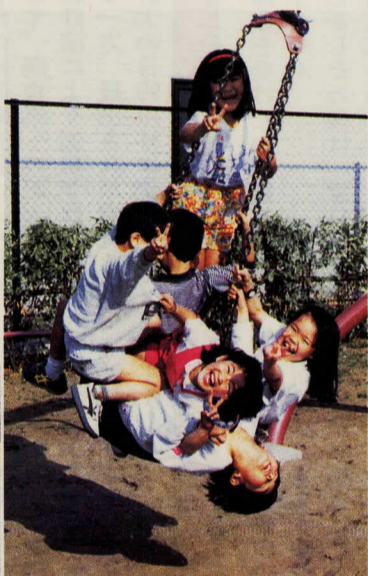
▲ タイヤブランコに乗って元気に遊ぶ子供たち。「ワー」「キャー」という声にぎやかです

調査で、名称はお年寄りと子供たちの考え双方を取り入れ、「いなりもりパーク」に決めました。シンボルとなる木はクスノキとし、ほかにイチヨウ、ケヤキ、クヌギ、ソメイヨシノなどを植栽することになりました。公園の広さは、四千七百五十平方メートル。砂場、木製遊具、ゲートボール場、藤棚、水飲み場、木製のベンチ、自転車置き場、トイレ、花壇など、各世代の希望がうまく調和して配されています。公園の説明板は自治会長が書き、入り口にある園名板には子供たちの絵タイルがはめ込まれ、砂場のトーマスポールにも子供たちが色を塗り、花壇の花はみんなで植えました。こうして、地域の夢は形になったのです。