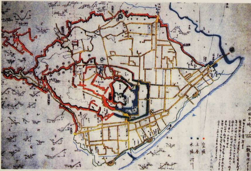
小田原城実測図(昭和13年陸軍省)

この頃までの小田原城の遺構は、現在のところ確認されていないが、箱根山の東麓に設けられた山城で、山裾に根小屋(居館)をもつ、ごく小規模なもので、城下町もきわめて狭い地域であったと思われる。早雲は、小田原入城後約二十年間、相模一国の平定に努め、