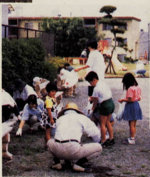
▲ 日曜日の朝、草むしりやごみ拾いをする地域の人たちの姿が

学校が終わる時間になると、自転車や徒歩で子供たちが集まり始めます。この中から、将来のスターが生まれるでしょうか