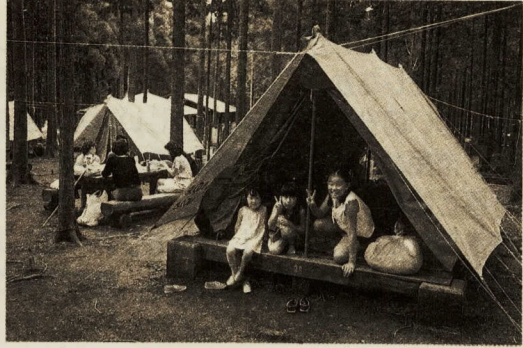
久野の森林レクリエーション公園「いこいの森」に、待望の

シャワー棟が完成、七月一日からご利用いただけます。シャワー棟は、障害者用一室を含む全十六室。それぞれの室内に、温・冷水のシャワーと更衣室があります。使用料は一回三分間二百円です。