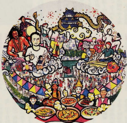
地球こたわり村まつり イメージ

皆さん、夏まつりウィークで盛り上げられるイベントに参加して、ぜひ、多くの喜びとまちづくりのエネルギーを感じてください。