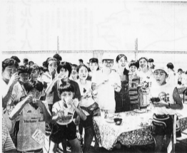
船上から瀬戸大橋をながめる子ども達（前列はさくら小児童会）

夏休み最後の日曜日、市内の小学生300人と関係者をのぞいて、豪華客船「うぼん丸」が横浜港を出発しました。この船は、おだわら市と横浜市の友好関係の象徴として、1972年（昭和47年）に就航しました。このクルーズには、おだわら市と横浜市の友好関係の象徴として、1972年（昭和47年）に就航しました。船中では、おだわら市と横浜市の友好関係の象徴として、1972年（昭和47年）に就航しました。船中では、おだわら市と横浜市の友好関係の象徴として、1972年（昭和47年）に就航しました。