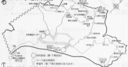
ふれあいシルバーバスほほえみ号 時刻表