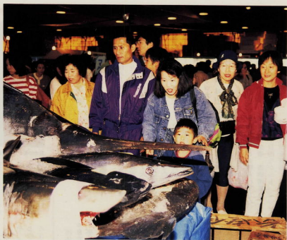
珍しい魚に驚く一面も