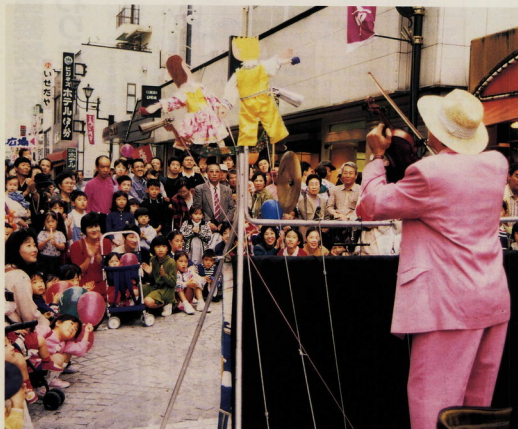
バイオリン & 操り人形の大道芸に見入る買い物客

十月三十日(日)、ワールド大道芸「小田原」と称した「幸田門市」が、お堀端商店街で開かれました。今年で四回目を迎えたこのイベントは、いきいきとした街づくりに努めながら、買い物客にもっと小田原の伝統・文化を知ってもらおうというものです。 大人も子供も、ワールドカップ出場の大道芸パフォーマンスの本格的な演技や、仮装パレードに笑顔で拍手を送っていました。また、若獅子舞や相模人形芝居の美演、歴史教室や数寄茶会、七宝焼飯や紙すき体験などの多彩な催しも行われました。