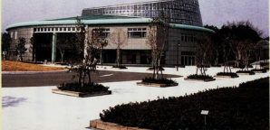
小田原フラワーガーデンは、環境事業センターのとなり ●伊豆箱根鉄道大江山線「嵐山」から徒歩20分 ●小田原駅から「海防線」行バスで終下車徒歩1分