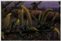
香川川の河原に咲くヤナギ類の花

香川川の川岸や流れに沿った中州には、多くのヤナギの仲間が生きて、7種が確認されています。香川にはネコヤナギの花を咲かせますが、種類によって多少時期が異なります。枯れ野で殺風景だった河原も、この花により春の訪れを感じることができ