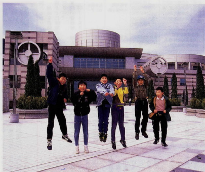
こんな博物館を持ってたよ

生命の星・地球博物館オープン ぼくらの星を探検だ！ 県と市の協同事業として市内入生田に建てられた自然系博物館が、三月二十一日オープンしました。博物館のテーマをそのま名前にした「県立生命の星・地球博物館」です。 真新しい扉が開くと、この日を待ちに待った子供たちが一斉に駆け込み、さっそく「生命の星」を探検。地球の生き立ちと生命誕生の不思議に感動し、巨大な恐竜や見たこともない生き物の姿に驚き、自然とも生きていくことの大切さを感じ取っています。 生命の星・地球博物館は、入生田駅から徒歩三分。開館時間は、午前九時から午後四時半まで。月曜日、祝日の翌日と整備点検日は休館です。電話番号は☎15-15です。