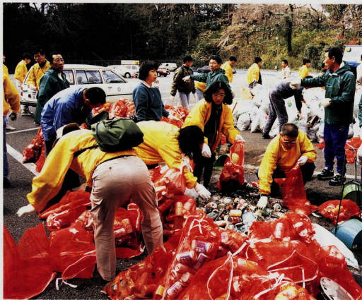
旧城内スポーツ・レクリエーション広場に集められた多量のごみ

桜のつぼみがほころび始めた小田原城址公園と周辺の市街地で四月二日、「タウンクリーンUPおだわら」が行われました。自治会や子ども会、企業などから千四百人余りが参加し、手に手にはほうきやゴミ袋を持ってまちを大掃除。一時間の清掃で集まったごみは、なんと二千六百七十キロにもなりました。 今月からは環境づくりの条例が施行され、いま小田原は「環境元年」。より美しく住みよいまちをつくるために、それぞれの地域で、私たち一人ひとりがよく考え、力を合わせるとして。