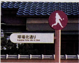
鴨宮南口通り、打越橋通り、球場北通り、新坂橋通り、球場北通り、新坂橋通りの6路線に設置予定。

市では、公共性の高い私道の整備費用の補助をしています。対象基準①②③④⑤⑥⑦⑧⑨⑩⑪⑫⑬⑭⑮⑯⑰⑱⑲⑳㉑㉒㉓㉔㉕㉖㉗㉘㉙㉚㉛㉜㉝㉞㉟㊱㊲㊳㊴㊵㊶㊷㊸㊹㊺㊻㊼㊽㊾㊿ 市では、公共性の高い私道の整備費用の補助をしています。対象基準①②③④⑤⑥⑦⑧⑨⑩⑪⑫⑬⑭⑮⑯⑰⑱⑲⑳㉑㉒㉓㉔㉕㉖㉗㉘㉙㉚㉛㉜㉝㉞㉟㊱㊲㊳㊴㊵㊶㊷㊸㊹㊺㊻㊼㊽㊾㊿