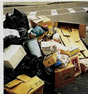
分別すれば大きな資源に……