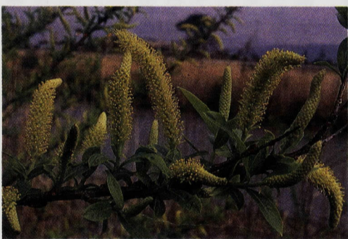
春 酒匂川の河原に咲くヤナギ類の花