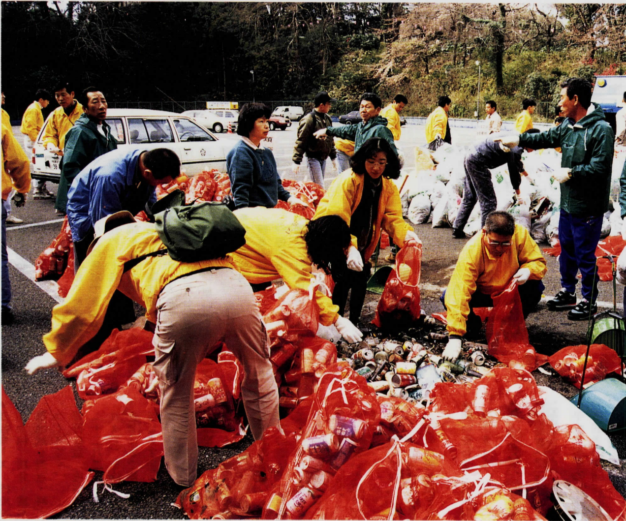
旧城内スポーツ・レクリエーション広場に集められた多量のごみ