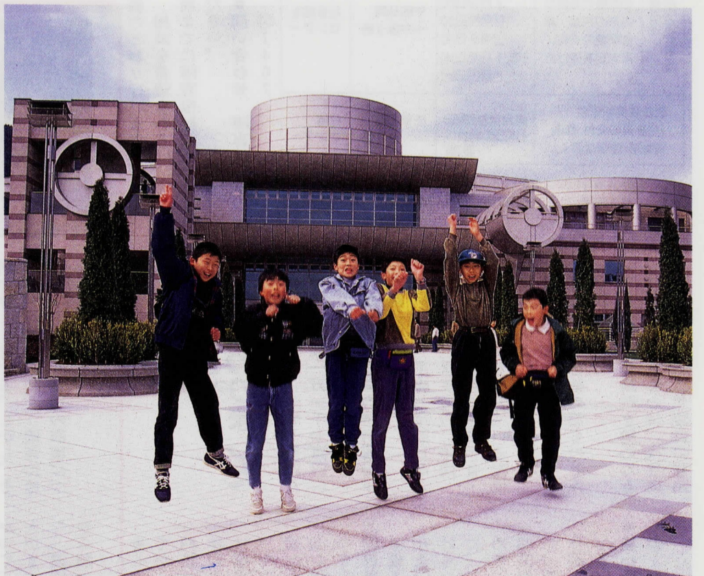
こんな博物館を待ってたよ