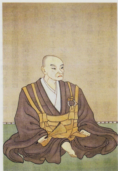
北條早雲画像(早雲寺蔵写し)

このころ、最も一般的なのは、「伊勢素浪人説」で、早雲を扱ったほとんどの小説や映画、さらにテレビドラマなどが「この馬の骨かも知れない根っから素浪人」という描き方をしていた。