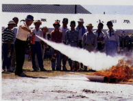
今年(平成7年)の総合防災訓練は、8月27日(日)に東富水地区の自主防災組織を対象に、関係機関と合同で行います。当日は市の防災行政無線で訓練情報の放送をする予定です。書害とお困りのないよう、訓練地域以外のご家庭にもご注意ください。