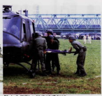
陸上自衛隊の災害派遣訓練

陸上自衛隊による災害派遣訓練や、海上自衛隊による救護物資などの輸送のための輸送艦接岸地点調査に協力しています。