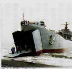
海上自衛隊の輸送艦