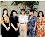
大津 齋藤 風巻 臨本 大村