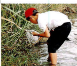
井上さんたちは三女一男そろって参加