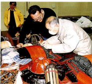
観光課 ☎ 33-1521

自慢の手作り甲冑を身につけて5月の北條五代祭りに参陣します。今年も甲冑教室が開催されますので、募集記事をお見逃しなく。