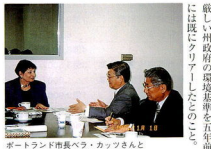
ポートランド市長ベラ・カッツさんと

海風が背後の山脈でさえぎられ空気が滞りやすい上、車の多いカリフォルニア州は、全米有数の大気汚染州である。サクラメントの州政府では、大気保全委員会のジョン・ダンロップ委員長始め各セクションの最高責任者から詳しい話を聞いた。