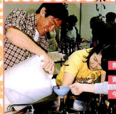
青年のつとめ 青年の新しい仲間づくり 今年は地ビールづくりに挑戦