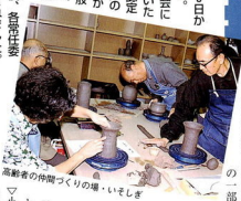
高齢者の仲間つくりの場、いそぎ

市議会12月定例会が、12月3日から17日間の会期で開かれました。この定例会では、9月定例会に提出され、継続審査となっていた平成7年度八宮企業の決算が認定されました。このあと、4件の報告に続いて、専決処分1件が承認された後、平成7年度一般会計と11件の特別会計の決算、補正予算、条例議案などが議案として提出されました。決算を除く議案は、10日以後、各常任委員会で審査され、17日に可決されました。決算は、12月定例会会期前後、決算特別委員会を継続審査されています。19日には、追加提出された小田原市職員