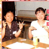
手話教室 福祉ボランティア教室 毎年たくさんの人が参加