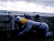
オイルボール除去作業に参加する若者達

「ほう、木当かなあ。申し訳ない話だが随分的にそう思った。つい何年前まで若い人達は、格好の良い、待遇の良い職場を求めて右往左往していた筈なのに。」「やりがい」とか「生きがい」とかいふ深い意味のある言葉とは、余り縁の無い存在と思っていた若者達が何時変ってしまったのか。しかし萌芽はある。青年海外協力隊への関心や一昨年の阪神・淡路大震災後の学生や若者達ボランティアの活躍ぶり、最近の日本海