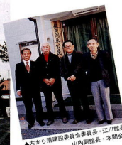
▲左から清建設委員会委員長・江川館長・山内副館長・本開会計