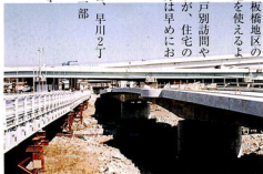
下水道事業と一体となって工事が進む早川橋