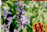
サルビア (上) ブルーサルビア