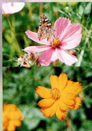
コスモス (上) 黄花コスモス