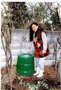
庭の隅にあるコンポスト。この手前には色とりどりの 季節の花が咲いていた。