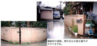
舗装前の道路。雨の日は大変な様子 がわかります。

私の家の前の私道は、そりやも うひどいものでした。生活道路に もかわらず、周りの土地より低 くなっているものだから、雨が降 ると側溝があふれ出し、道路上20 センチも水がたまり、道路がどこ にあるのかもわからないほどだっ たんです。 それでも、手探りでこの側溝の ふたを持ち上げて泥などをかき出 さないと、水は吹き出すし落ちた ら危ないし、大変でした。なにし る独特の臭気の中で、びしょぬ