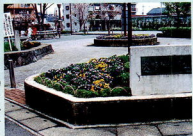
お弁当を広げる姿も見られる久野晃河原公園の花壇

花は人の心に安らぎを与え、見ているだけで心なごむものです。花を植え、環境を美しくするという同じ目的に向かって、若者もお年寄りも協力して、心豊かなまちづくりの一翼を担っていきなさいと考えています。