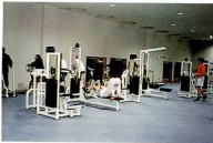
逆三角形、ヒップアップはこれでばっちり。