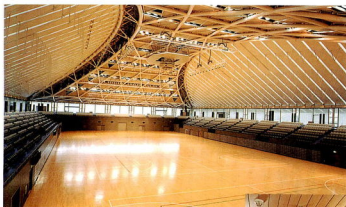
広いメインアリーナでは、室内サッカーやテニスなどもできてしまう。ふんだんに取り入れた自然光がうれしい。

スポーツで汗を流すのに気持ちのいい季節。できれば住まいの近くがいい。料金が安ければもっといい。となれば、公共施設が一番。南足柄市や足柄上郡、下郡の施設も利用できる 広域スポーツ施設相互利用も進み、バラエティに楽しめます。