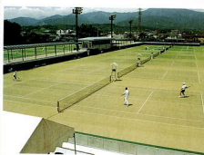
小田原テニスガーデン