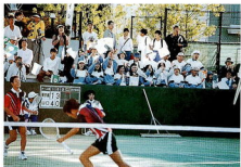
山口県チームに声援を送る北ノ富地区民治協会の皆さん。