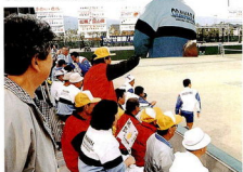
徳島県チームに声援を送る豊富水第4地区民治協会の皆さん。