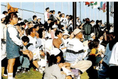
富山県チームを受け入れた穴部地区民治協会の100人を越える大応援団。

県名や選手の名前、「がんばれ」などのさまざまなメッセージを書いた応援の旗を振り、熱心に声援を送る姿がそこかしこで見られました。