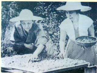
自宅の庭で夫人と梅を干す(昭和41年)

なお、文学碑は、市制40周年記念事業として、昭和56年4月26日に宗我神社鳥居わきに建立された。碑文 富士は天候と時刻とによって身じまひをいろいろにする 晴れた日中のその姿は平凡だ 真夜中夢を渡る月光の下に 鈍く音もく光る富士 未だ 星の光が残る空に 頂近くは バラ風脚体は暗紫色にかがやく 眺方の富士 「虫のいろいろ」より