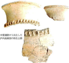
▶中里遺跡から出土した瀬戸内海東部の弥生土器

弥生時代の大規模な集落としては東日本で最古の遺跡が中里で発見されました。中里遺跡の調査は、今年3月から本格的に始められました。これまでに弥生時代中期・中葉（紀元前2世紀ごろ）竪穴住居跡67軒、竪立柱40棟のほか、土杭や川の跡などが見つかっていました。 出土した土器の中には多量の瀬戸内東部地方の土器が含まれていました。この土器が出土したことから、中里遺跡と瀬戸内東部地方との強い結びつきが考えられ、準半構造船など海上ルートを使って物資の大量輸送、あるいは瀬戸内の弥生人たちが集団で移動してきたの