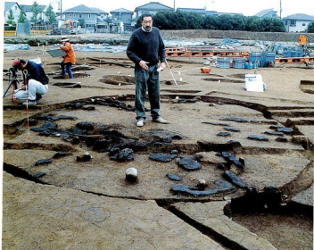
▲発掘調査が進む中里遺跡