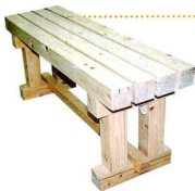
▲ひのきの間伐材を使った椅子。 普通は手に入らないような値段で作れるとか。

○共通事項 定員 12人・先着順 費用 2,700円 申込 3月16日(火)から、 農政課 ☎ 33-1492