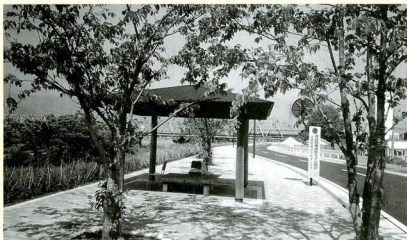
酒匂川に沿ったこの道路は、酒匂川の水辺

あなたは、まちづくりについてサイレントマジョリティ(傍観者)になっていませんか。まちづくりの主体は私たち市民一人ひとりで。私たちのまちをもっと住み良い、優しいまちにするために、市長への手紙制度や、市民と市長との懇談会、市政モニター制度などを行っています。