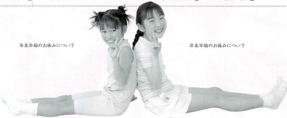
年末年始のお休みについて