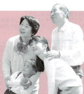
まちづくりデザイン課 ☎33-1379

地方分権や少子・高齢化の進展など地方自治体を取り巻く環境が大きく変化しているなかで、歴史的にも生活圏としても結びつきの深い小田原市、箱根町、真鶴町、湯河原町の1市3町が、地域の将来像や今後のまちづくりについて住民の皆さんと考えるために、(仮称)西さがみ連邦共和国建国記念式典とフォーラムを開きます。