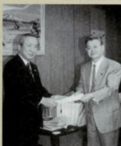
総務省の副総務事務次官と小澤市長

今後とも、地方分権を推進するという大きな責務のため、全国特例市連絡協議会の会長市として、リーダーシップを発揮していきます。