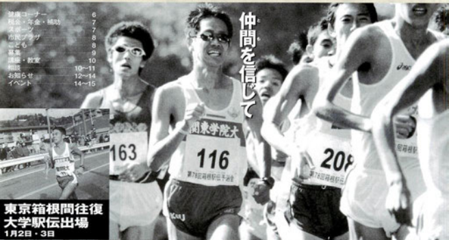
東京箱根間往復 大学駅伝出場 1月2日・3日