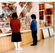
写真は昨年の午展