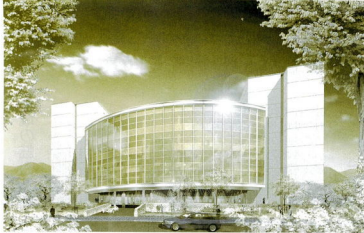
↑イメージ図（お城通り側から）