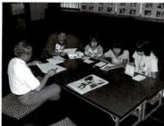
— 絵本のよみきかせ —