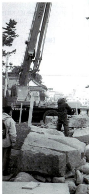
<馬出門復元イメージ>