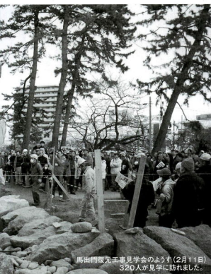
馬出門復元工事見学会のようす(2月11日) 320人が見学に訪れました。