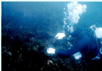
カジメの育成状況を確認する試験場の職員。このカジメが御幸の浜に移設されました。

現在、育っている人工リーフの藻場は、相模湾全体から見ればとても小さいものなので、海