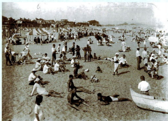
海水浴客でにぎわう昭和初期の御幸の浜。広い砂浜が印象的です。

実験では、まず、カジメが胞子を出す秋に、海藻類が集まり生い茂る場所、「藻場」がある江の浦沖合に、人工リーフになる