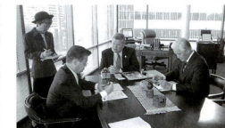
ニッケルズ市長、下村市議会議長と(シアトル市市長室にて)

ルド・シティ ② 。とも称されるシアトルはまさに紅葉の始まりであった。シアトル発祥の地一帯の歴史的建造物保存地区に象徴される落ち着いた街並みが私達を温かく迎えてくれた。 環境に配慮したと自慢の新しい市庁舎では、オルトン国際交流局主席専門員が待つていてくれた。市の概要説明を受けた後、ニッケルズ市長との会談に移った。 都市経営の苦心談から景観、教育、家族愛の話に至るまでの幅広い意見交換の中で、特に環境問題への市長の強い入れが印象に残った。地球温暖化防止の為の京都市議定書に批准しない連邦政府を非難し、市長のリーダーシップで全米市長会議に呼びかけ、既に三十四市長が批准に賛成し、その人口は五千三百万人にもなるということだった。政治家としての迫力、家庭人としての素顔まで垣間見せてくれた市長との貴重な一刻であった。