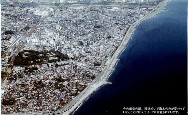
今の御幸の浜。砂浜沿いで海水の色が変わっているところには人工リーフが設置されています。