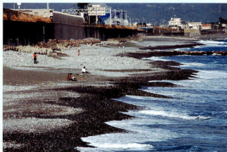
現在の御幸の浜。砂浜は回復途中。

人工的に整備した藻場が10年間にもわたり成長していったことは、全国的にも貴重な例となりました。