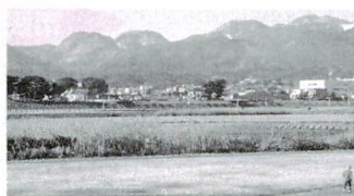
浮世絵に描かれた酒匂の渡し

小田原の 身近な風景 を見つめ直し、 愛着を深め ていただく ために募集。 選定した「ふ るさとの原 風景百選」。 この原風景を歩いて巡る会の参 加者を募集します。 期日・地域コース ① 9月22日(土) 「片浦」 ② 9月29日(土) 「鴨宮」 ③ 10月6日(土) 「橘」 ④ 10月13日(土) 「国府津・曾我」 ⑤ 10月20日(土) 「富水・桜井」 ⑥ 10月27日(土) 「中央」 時間 9時~15時ころ 申込 9月7日(金)まで(必着) に、住所・氏名(ふりが な)・電話番号を書いて、 はがき、ファクスまたは 電話で。