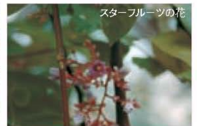
スターフルーツの花

スターフルーツは、熱帯アジア原産でカタミ科の熱帯果樹です。グレンシとも呼ばれるこの果実を切ると、断面が星形に見えることから、このような名前がつけられました。