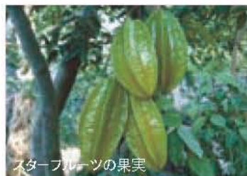
スターフルーツの果実

フラワーガーデン ☎34-2814 http://www.city.odawara.kanagawa.jp/public-1/park/o-furawa.html