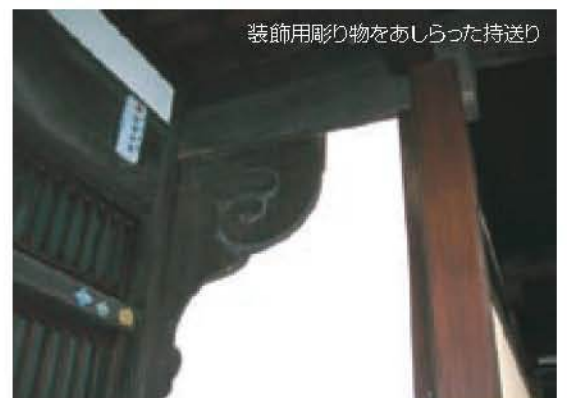
装飾用彫り物をあしらった持送り