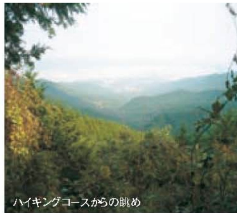
ハイキングコースからの眺め

心に地域のかたが里山の保全に向けた活動団体、「(仮称)美しい久野里地里山協議会」を設置し、土地の所有者などと活動の協定を結んで、田畑の再生や環境保護、散策道の整備などの活動を行っていく予定です。里地里山は久野地域にあるものだけではありません。豊かな自然に囲まれた市内にはまだ数多くの里地里山が残っているはず。