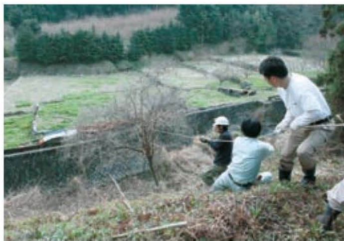
坊所での雑木の伐採

里山は、人々が適度に手を入れ続けることで、生活面や環境面はもちろんのこと、防災という観点からも日々の暮らしを守っていたのです。しかし、人々のライフスタイルは