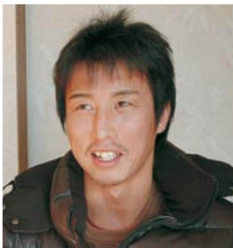
プロボクシング・ 日本フェザー級チャンピオン

元気あふれる人たちの笑顔は、見ている人たちにも力を与えてくれるもの。このコーナーでは、みんなが元気になるように、素敵な笑顔をお届けします。