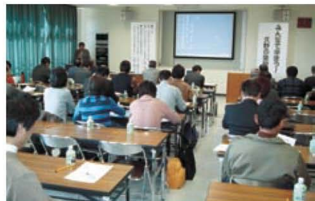
フラワーガーデンでの勉強会

さまざまな取り組みを行いました。フラワーガーデンで勉強会「みんなであらぼう！久野の里地里山」を開いたり、地域を再発見するために地域内を歩いたり、景観づくりのために坊所地域で雑木の伐採をしたりしてきました。