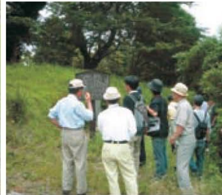
現地ウォークでのようす