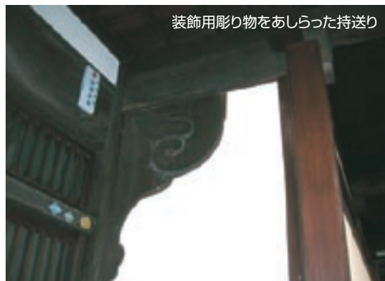
装飾用彫り物をあしらった持送り