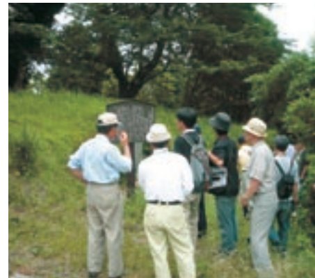
現地ウォークでのようす