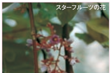
スターフルーツの花

スターフルーツは、熱帯アジア原産でカタバミ科の熱帯果樹です。グレンシとも呼ばれるこの果実を切ると、断面が星形に見えることから、このような名前がつけられました。主に生食、ゼリー、薬用などに利用され、花は小さく桃色で芳香があります。トロピカルドーム内(有料)で見られます。