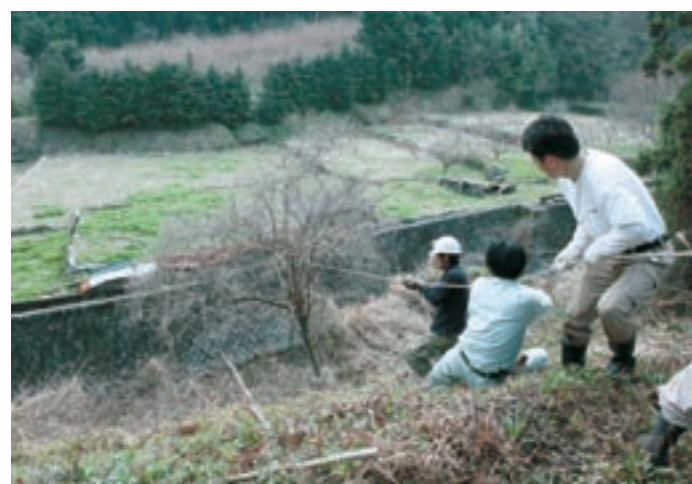
坊所での雑木の伐採

里山は、人々が適度に手を入れ続けることで、生活面や環境面はもちろんのこと、防災という観点からも日々の暮らしを守っていたのです。しかし、人々のライフスタイルは