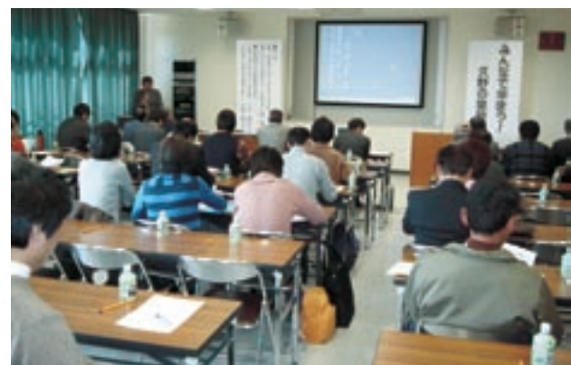
フラワーガーデンでの勉強会

さまざまな取り組みを行いました。フラワーガーデンで勉強会「みんな学ぼう！久野の里地里山」を開いたり、地域を再発見するために地域内を歩いたり、景観づくりのために坊所地域で雑木の伐採をしたりしてきました。