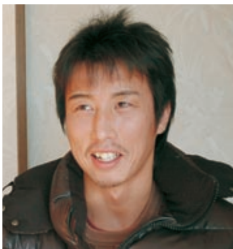
プロボクシング・ 日本フェザー級チャンピオン

元気あふれる人たちの笑顔は、見ている人たちにも力を与えてくれるもの。このコーナーでは、みんなが元気になるように、すてきな笑顔をお届けします。