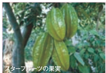
スターフルーツの果実

☎フラワーガーデン ☎34-2814 http://www.city.odawara.kanagawa.jp/public-i/park/o-furawa.html