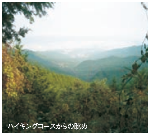
ハイキングコースからの眺め

心に地域のかたが里山の保全に向けた活動団体、「(仮称)美しい久野里地里山協議会」を設置し、土地の所有者などと活動の協定を結んで、田畑の再生や環境保護、散策道の整備などの活動を行っていく予定です。里地里山は久野地域にあるものだけではありません。豊かな自然に囲まれた市内にはまだ数多くの里地里山が残っているはず。