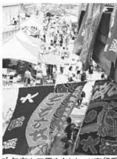
昨年度小田原みなとまつり実行委員会長賞「賑わう港まつり」

市内の港・海岸と人との「触れ合い」、小田原みなとまつりがテーマです。優秀作品は、8月の「小田原みなとまつり」で表彰します。