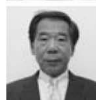
教育長 前田輝男さん

【市ホームページアドレス】 http://www.city.odawara.kanagawa.jp/