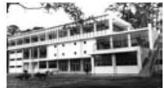
中庭から見た建設当初の星崎記念館