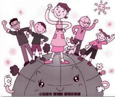
小田原市 環境課 環境政策課

地球温暖化、オゾン層破壊、酸性雨などの 地球環境問題は 、 私たち人間やさまざまな生物が生きる地球の存続を脅かす 重大な課題 です。 私たち 小田原市 は、このような地球の危機を自らの課題として考え、 定もとの 取り組み を推進します。