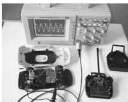
電波の波形を調査する「デジタル・オシロスコープ」。92,000円の助成を受けて購入しました。

困っていたときに補助金制度を知り、スタートアップコースに申し込んだところ、機械の購入費全額の補助を受けることができました。