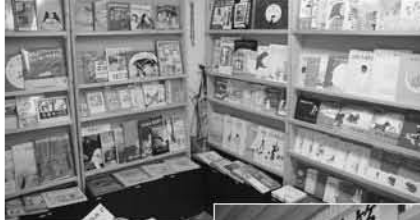
「子どもの本箱」の入口（下）と、内部。厳選された多くの絵本や児童書が並んでいます。

昨年度、スタートアップコースの補助を受けて始まったセミナーですが、2年目の今年度は、ステップアップコースの補助を受けるまでにパワーアップ。参加者も、子育て中のお母さんや読み聞かせサークルの方など約70人にのぼったそうです。「くらべ読みセミナーをもっと