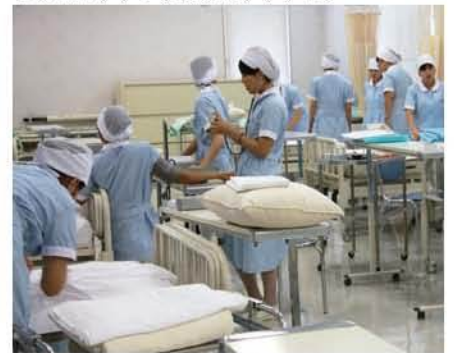
病院実習に向けて技術練習をする1年生

看護師不足が深刻な昨今。わがまち小田原も、地域医療の根幹にかかわる大切な問題に直面しています。今年4月に創立15周年を迎えた同校は看護学科において豊かな人間性を形成し、安全な医療を提供するための幅広い知識と技術を兼ね備えた看護師の育成に取り組んでいます。