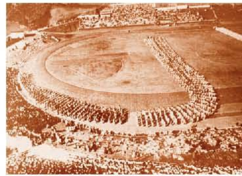
国体開催に合わせて行われたマスゲームのようす(城山陸上競技場)

これを契機として、同年8月25日、当時全国屈指の施設といわれた並列8面のコートを備えた城山庭球場が完成し、同月27日には、竣工記念行事として全日本学生軟式庭球選手権大会が開催されました。