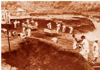
体育関係者による奉仕作業のようす(城山陸上競技場)

国体は、新装の城山競技場でマスゲーム(多人数が一団となつて行う体操やダンス)が披露されたあと、10月30日から11月3日まで、ソフトテニスが城山庭球場と県立小田原高等学校庭球場で、また、ソフトボールが市営球場、天神山球場、県立小田原高等学校運動場で行われ、一流の選手たちの素晴らしいプレー