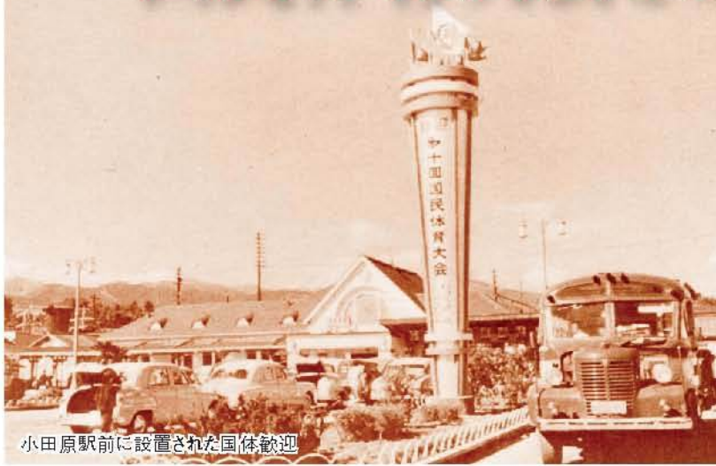
小田原駅前に設置された国体歓迎