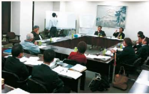
検討委員会のような様子

昨年5月から始まった自治基本条例づくり。市民の持っている「市民力」をまちづくりに生かしていくこと、市民・議会・行政が「協働」してまちづくりに取り組んでいくことなどを定めるもので、市民が持つまちづくりへの情熱や力がより発揮しやすい、市民主体の「協働」がより盛り上がる、活力ある小田原につながる条例を目指しています。