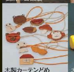
木製カーテンどめ