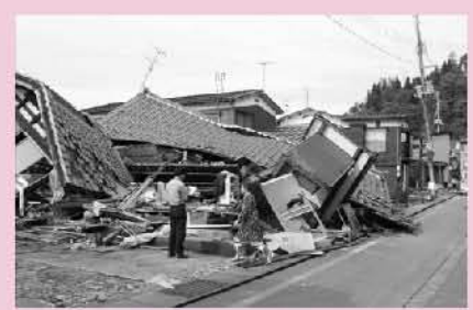
新潟県中越地震の被害状況