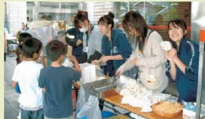
昨年のフェスティバルの様子

では欠かせない存在です。そしてまた、学生にとっても、「老年看護学」の現場実習として位置づけられ、大切な学びの場になっ