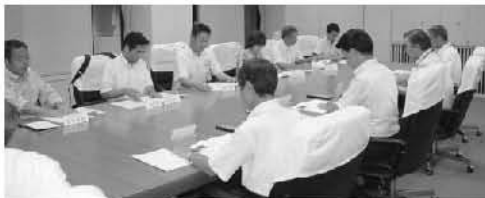
骨子案提出時の意見交換

小田原では昨年来、さまざまな分野における市民主体の検討委員会が立ち上がり、私たちが抱えている深刻な課題を解決する方法論を議論し、仮説を作り、モデル事業を立ち上げ、試行錯誤を重ねています。そ