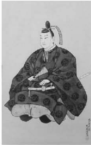
尊徳の仕法を「徳をもって徳に報いる」(報徳)と賞賛した 大久保忠真公

例えば、 親から家・財産を譲られても、その人に、親や先祖の恩を思う心がなければ、