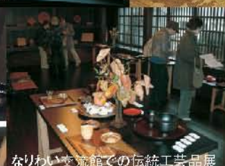
なりわい交流館での伝統工芸品展