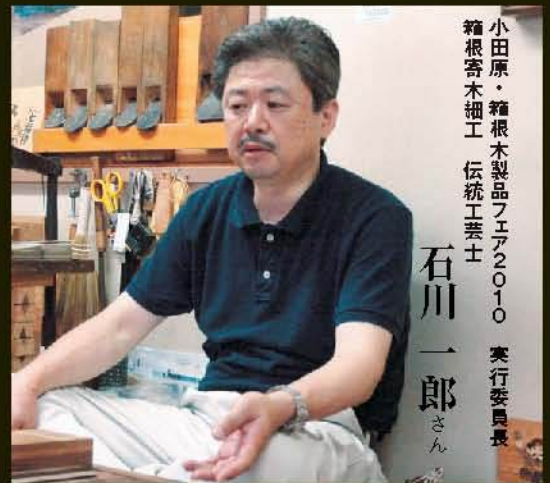
小田原・箱根木製品フェア2010 実行委員長 箱根寄木細工 伝統工芸士