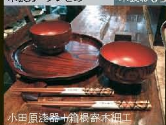
小田原漆器+箱根寄木細工