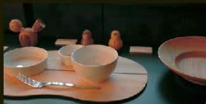
木製品を使った洋食スタイル

小田原・箱根地域には、国が「伝統的工 芸品」に指定する、箱根寄木細工や小田原 漆器をはじめ、指物、組木、木象嵌、秘密箱、 玩具などの木製品のほか、铸件やちょうち んなど、誇るべき工芸品がたくさんあります。 脈々と受け継がれてきた「技」と「匠」、 生み出される工芸品の「いのち」。 伝統の技は、ただ受け継がれるだけでな く、多様化する生活スタイルに取り入れら れるよう、さまざまなものを生み出してい ます。 工芸品を扱う各店舗や街かど博物館、各 種展示会などで、それらを、目にし、手に 取り、感じる事ができるのは、とても貴 重であり、私たちには、そういった環境を 次代に引き継ぐ責任があります。 見る者を喜ばせ、驚かせ、生活を潤す工 芸品。この秋、あなたもぜひ、その魅力に 迫ってみませんか。