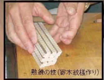
熟練の技(寄木紋様作り)