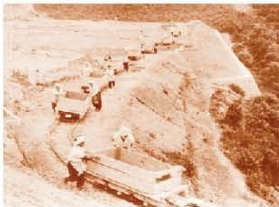
トラックで土砂を運ぶ労働者のようす(城山陸上競技場)