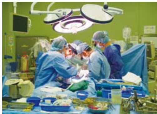
心臓血管外科では手術を中心にいきます。

心臓血管外科は、平塚共済病院心臓血管外科と連携して、冠動脈疾患や弁膜症、大動脈疾患といった心臓血管外科領域の患者さんの治療を行っています。特に冠動脈疾患には、人工心肺を使用しないで心臓を動かしたまま手術する、オフポンプバイパス術を行っています。また、腹部大動脈瘤では適応すれば、腹部を切らずに治療可能なステントグラフト内挿術を積極的に進めています。手術は4〜5時間に及ぶこともありませんが、スタッフは休みを取ることなく救命に取り組んでいます。