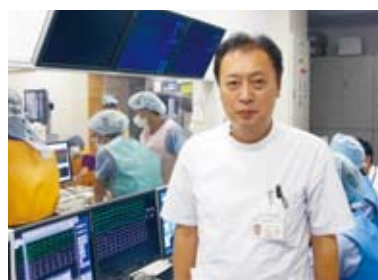
川口センター長（副院長・診療部長）

日頃から循環器内科・心臓血管外科が合同で患者さんの症例を検討するカンファレンスを行うなど、連携を密に治療方針を決定しています。