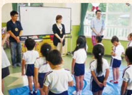
木について学ぶ子ども

活動も4年めとなり、真剣に木工作品を作る子どものようすや、自分たちの作品で楽しそうに遊ぶ子どもの姿を見て、熱心に取り組んできた成果を感じることができます。