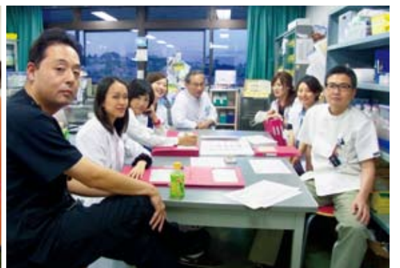
産婦人科は毎日、患者さんの症例を検討するカンファレンスを行い、情報共有を図っています。