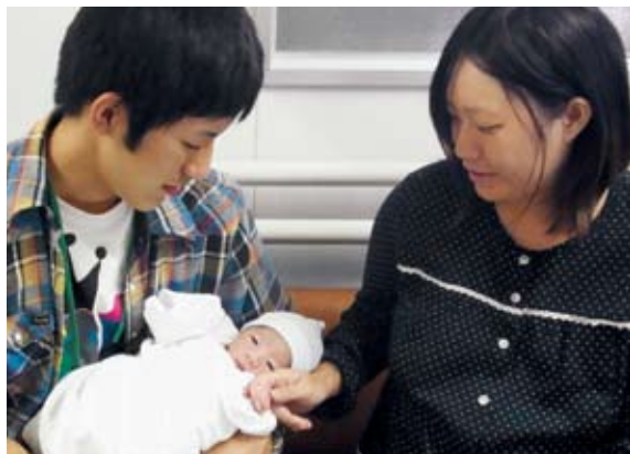
元気に生まれた赤ちゃんとお父さんの初対面

NICUは6床あり、妊娠28週以降の出産や、体重1000グラム以上の赤ちゃんの入院が可能です。合併症を少なくして順調に育ってほしいと、スタッフは、日々、治療と看護に取り組んでいます。