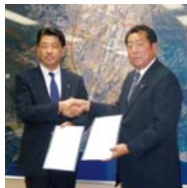
市と佐川急便(株)が見守り協定を締結

者を適切に保護することとしました。 市では、民間の協力を得て、さらに孤立死・孤独死の防止に努めていきます。