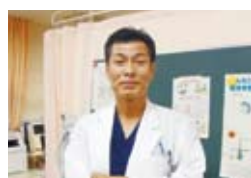
循環器内科・東谷担当部長

院内外で連携 循環器センターでは、医師だけでなく精密機器を扱う臨床工学技士や放射線技師、看護師、薬剤師、栄養士などがチームとして患者さんをサポートします。重篤な状態から回復し、無事に退院して入院前と同様の社会生活を送れるようになることを目指しています。病状が安定してからは、かかりつけ医に診療していただくなど地域との連携も欠かせません。 難しい病にできるだけかからないように、生活習慣病はもとより、脳卒中や心筋梗塞を予防するため、心疾患の原因となる生活習慣病の管理や、また、居眠り事故にもつながる睡眠時無呼吸症候群の診療も行っています。 しています。各診療科の「専門医」と連携した診断で、合併症の入院患者さんの管理をしています。