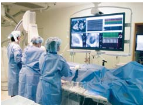
カテーテルにより心臓の動きや冠動脈の状態を検査し、必要に応じ血管内手術も行います。

不整脈診療にも力を入れています。脈拍がゆっくりになる「徐脈性不整脈」には、ペースメーカー療法を、脈拍の速くなる「頻脈性不整脈」には、高周波通電により不整脈発生源を断つ「カテーテル心筋焼灼術」を、突然死の危険性のある「致命的不整脈」には、植え込み型除細動器療法を行っています。「薬物治療抵抗性の心不全」の患者さんには、心臓に左右両側から同時に刺激しペーシングを行うことで、心機能の回復が期待できる「心臓再同期療法」を取り入れています。足壊疽、足切断のおそれのある「閉塞性動脈硬化症」といった血管疾患へのカテーテル治療も積極的に行っています。 こうした、症状に応じた治療を選択できるように、医師は、新しい治療法の研究や技術の向上に努めています。