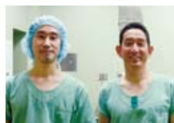
右から心臓血管外科・石川科部長、畠田医長