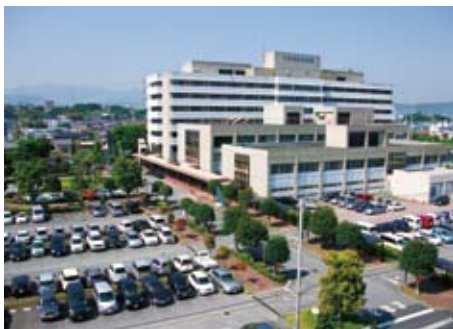
病院外観。敷地内は全面禁煙