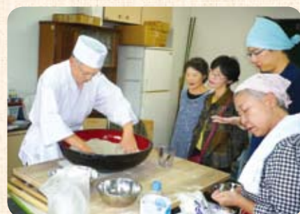
手打ちそばランチの会

月3回ほど開くカフェサロンでは、若者たちが手作りスイーツを提供したり、手芸や小物作りをしたり、多くの人と交流しています。「手打ちそばランチの会」なども企画し、コミュニケーションの場を広げています。また、臨床心理士など専門家による講演会も開催しています。