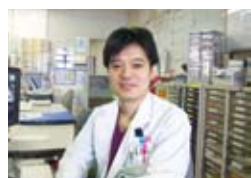
循環器内科・弓削科部長

日頃から循環器内科・心臓血管外科が合同で患者さんの症例を検討するカンファレンスを行うなど、連携を密に治療方針を決定しています。