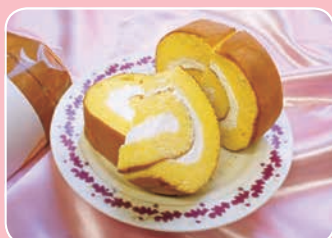
米粉ロール ケーキショップ スウィート・ベリー 下堀店(下堀95-1) ☎43-8840