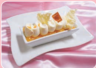
バター マンダリン 一夜城 Yoroizuka Farm (早川11352-110) ☎24-3150