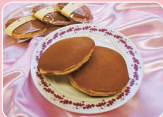
湘南ゴールドクリームどら焼き 御菓子処 盛月(板橋648) ☎22-3860