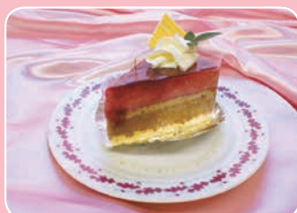
ブラック・ベリームース 創菓工房 なかじま(堀之内243) ☎36-1267