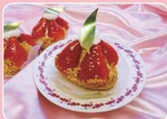
和田さん家の苺のタルト かし 櫻の樹(曾比2209-1) ☎36-8838