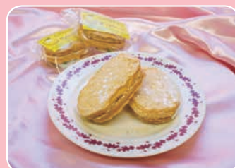
小田原レモンのダックワーズ 小田原洋菓子店 フロマージュ (中里185-17) ☎47-1911