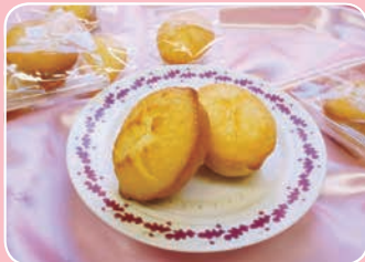
小田原蜂蜜れもんマドレーヌ 和颯(WA SOU)(本町2-9-4) ☎87-6156