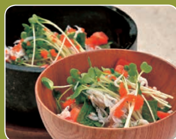
ポルト イル キャンティ(早川1-6-5)