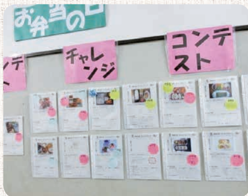
白鷺中学校で実施したお弁当コンテスト

いつもの給食とは違う雰囲気の中で、会話が弾みます。お弁当が入ったバッグを大事そうに抱えて登校するほほえましい姿も見かけました。先生が選んだお弁当を文化祭で発表するなど、お弁当づくりを通じて活動の輪が広がります。