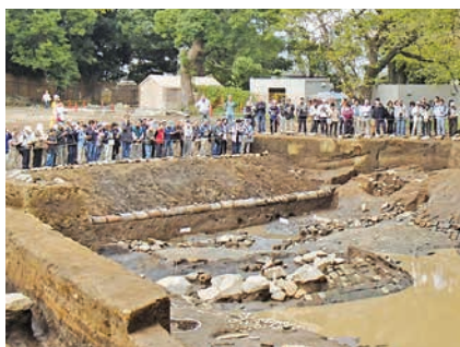
御用米曲輪での現地説明会

文化財課では、出土品を「最新出土品展」で展示し、また、遺跡の現地説明会や遺跡発表会などで市内の遺跡の情報を公開しています。