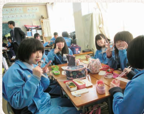
白鷺中学校弁当の日