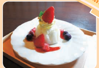
ぎゅうひで包んだバニラアイス イチゴソース添え 小田原お掘端 万葉の湯(栄町1-5-14) ☎23-1126