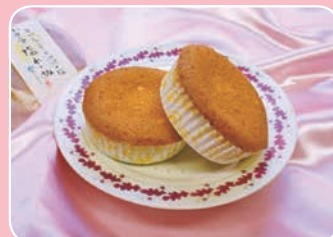
小田原塩れいぬ ちいさな森のスイーツ もくもく (西酒匂1-5-11) ☎43-9003