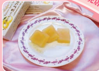
片浦レモンの生ようかん 伊勢屋(本町3-6-22) ☎22-3378