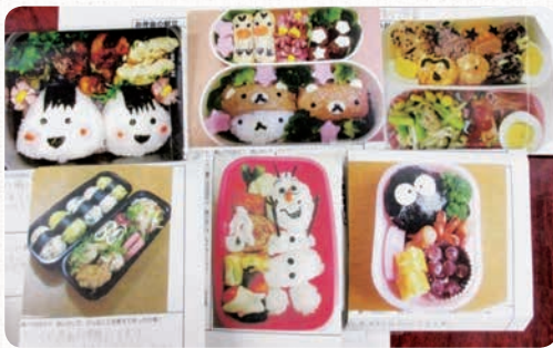
他にもたくさんの力作の応募がありました。

応募作品のレシピ集を作り、校内やイベントで配布します。料理が得意な子も、今まで自分でお弁当を作らなかった子も、レシピ集を参考にお弁当を作ってみましょう。