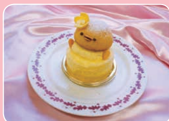
“おだわらスイーツプレミアムヴァージョン” ひよこのマーチ パティスリー プティ タプティ (蓮正寺133-1-103) ☎37-8580