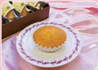
小田原レモンのマドレーヌ パティスリー ガロパン(成田294-3) ☎87-6544