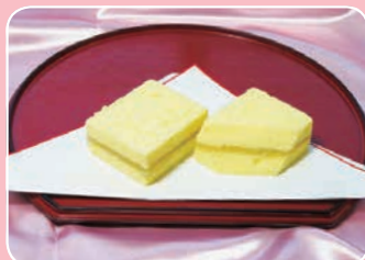
小田原レモンとうふ 正栄堂菓子舗(栄町1-1-9小田原ラスカ1階) ☎34-2222