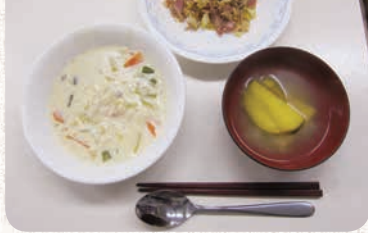
野菜とベーコンのいためもの(上)、クリームシチュー(左)、さつま汁(右)