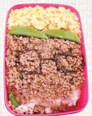
国府津中学校生徒によるお弁当