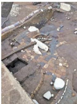
御用米曲輪で発見された、きりいしじま切石敷の庭園

御用米曲輪の発掘調査は、今年度で一区切りとなります。今後は、多くの人が親しみを持って利用できる史跡公園に整備します。