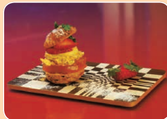
四季折々のミルフィーユ ポルト イル キャンティ(早川1-6-5) ☎23-6220