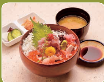
うおくに(栄町1-1-7 ハルネ小田原)