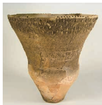
羽根尾貝塚で出土した縄文土器

羽根尾貝塚では、平成4～11年に発掘調査を実施。遺跡が粘土質の土で覆われていたため、遺物は劣化せず、極めて良好な状態で出土しました。土器などに施された細工は、5500年前の縄文時代の人が作ったものとは思えないほど繊細です。出土した土器や木製品、骨製品など458