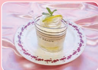
湘南ゴールドレアチーズ 洋菓子館 ボナール(南鴨宮1-7-1-121) ☎47-0345