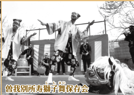
曾我別所寿獅子舞保存会