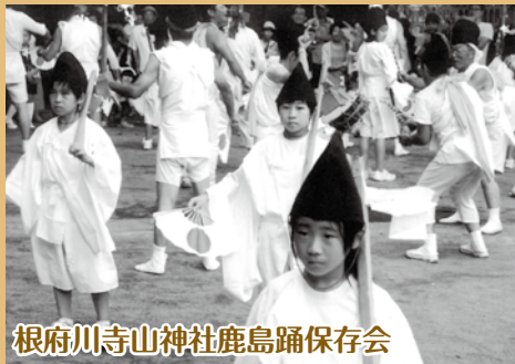
根府川寺山神社鹿島踊保存会