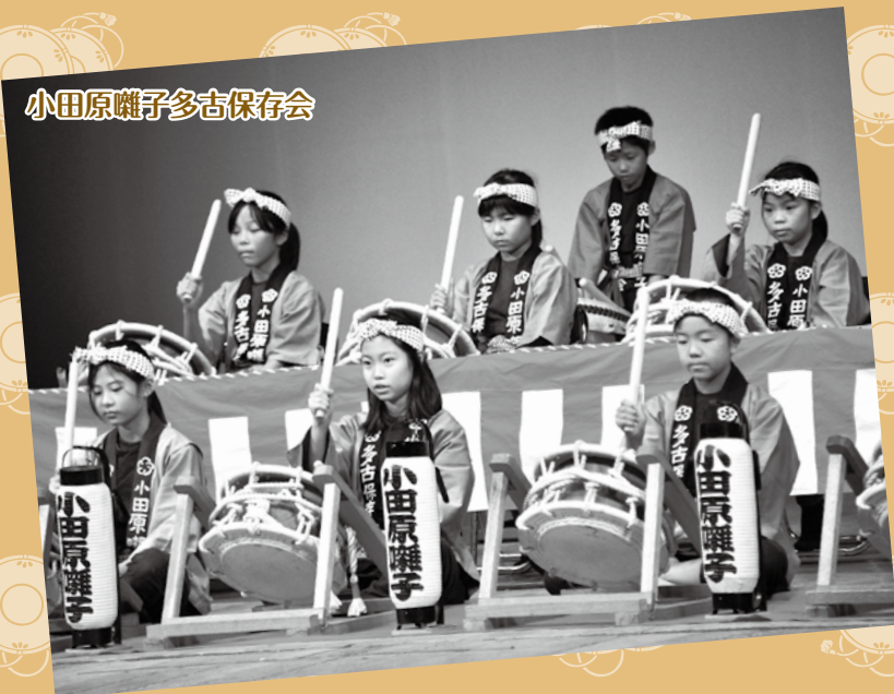
小田原囃子多古保存会