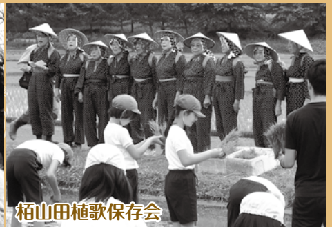
栢山田植歌保存会