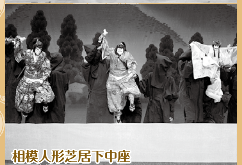
相模人形芝居下中座