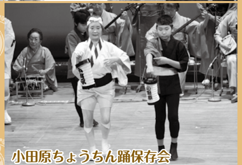
小田原ちようちん踊保存会