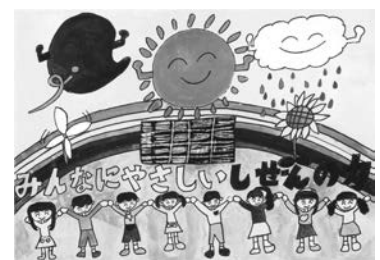
▲市長賞 小学生の部作品