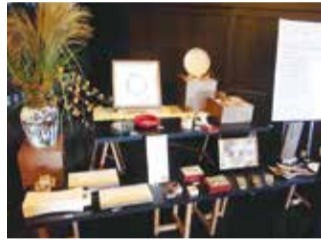
▲春に清閑亭で行われている「いぶき展」

さまざまな木工業に従事している若い職人が集う「いぶき会」。若者らしい感覚で作品を発表したり勉強会をしたりするために結成されました。展示会などを通じて、木工の魅力・産地の魅力を発信しています。