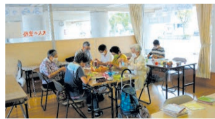
▲下府中地区 「ふらっとマロニエ」での活動のようす