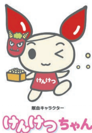
献血キャラクター