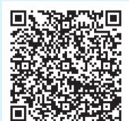
▲子育てカレンダー