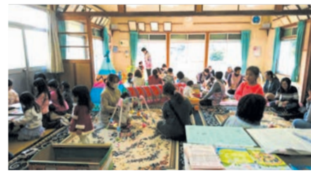
▲上府中地区 子育てひろばでの活動のようす